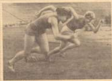
Состязания прошли в Ленинграде и других городах страны.

В школах Ленинграда и других городов страны усилено внимание к воспитанию у молодежи чувства ответственности за судьбу своей Родины. Учителя стараются привить детям любовь к труду, уважение к старшим, патриотические чувства. В школах проводятся различные мероприятия, направленные на формирование у детей высоких моральных качеств. Учителя стараются привить детям любовь к труду, уважение к старшим, патриотические чувства. В школах проводятся различные мероприятия, направленные на формирование у детей высоких моральных качеств.